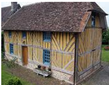
CASA TÍPICAMENTE NORMANDA

La región ocupada por los vikingos recibió el nombre de "Normandía", transformado en Normandía y sus habitantes: normandos. Rollón se convirtió al cristianismo y adoptó el nombre de Roberto.